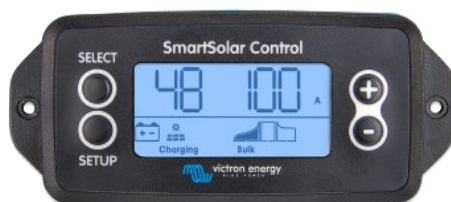
Подключаемый экран SmartSolar