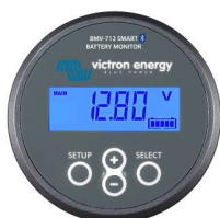
Bluetooth-датчик: BMV-712 Smart Battery Monitor