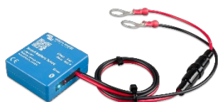
Bluetooth-датчик: Smart Battery Sense