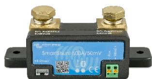
Датчик Bluetooth: SmartShunt