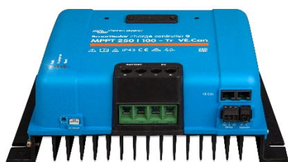
Контроллер заряда SmartSolar MPPT 250/100-Tr VE.Can без экрана