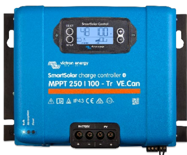
Контроллер заряда SmartSolar MPPT 250/100-Tr VE.Can с опциональным подключаемым экраном